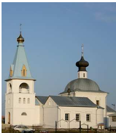
ХРАМ СВЯТИТЕЛЯ НИКОЛАЯ ЧУДОТВОРЦА.